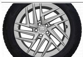
Komplet kół zimowych NG_RX19"