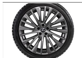
Komplet kół zimowych NG_RX 21"