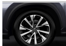
KOMPLET KÓŁ ZIMOWYCH NGNX 18" Z NAKRĘTKAMI ZABEZPIECZAJĄCYMI LEXUS