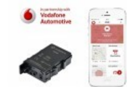
Zabezpieczenie antykradzieżowe Vodafone z lokalizacją GPS