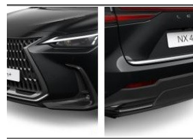
Pakiet NX_Chrome (NX_Chrome)