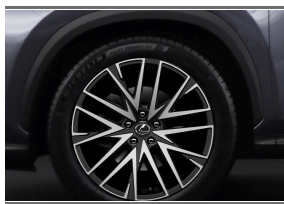
KOMPLET KÓŁ ZIMOWYCH NG NX 20" LEXUS

Polecane akcesoria niewliczone do powyższej kalkulacji