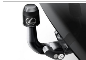
Hak holowniczy z wiązką elektryczną (NGNX_HAKS)