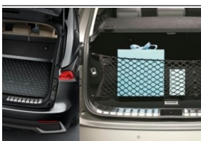
Oferta promocyjna! Pakiet z gumową wykładziną bagażnika i pionową siatką. (NGNX_CASE)