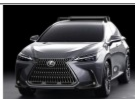
BELKI DACHOWE (PW301-78001)

Polecane akcesoria niewliczone do powyższej kalkulacji