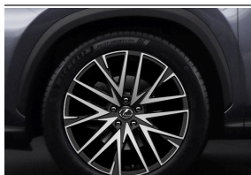
KOMPLET KÓŁ ZIMOWYCH NG NX 20" YOKOHAMA LEXUS